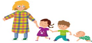
La Bressoleta ESCOLA BRESSOL MUNICIPAL