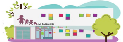
LA BRESSOLETA | Montevideo